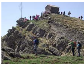
Liguria - Monte Ramaceto