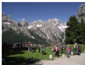
Dolomiti di Brenta-Cima Croz