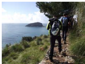
Liguria - Portovenere - Palmaria