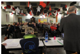
71^ Assemblea sociale