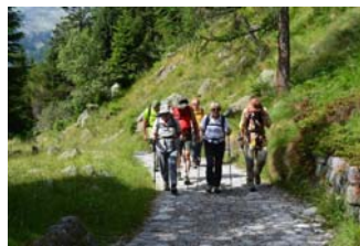
Trentino - Val di Fumo