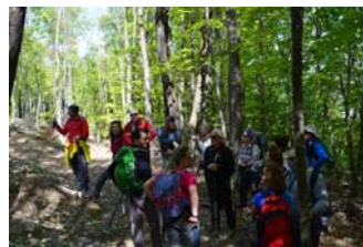
Valli Trebbia e Tidone