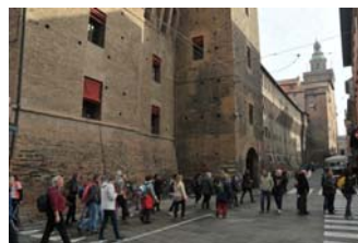
Visita culturale a Bologna