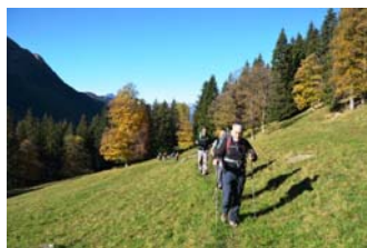
Valle di Sclavi - Monte Gardena