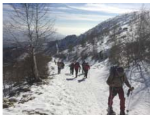
Piemonte - Punta dell'Aquila