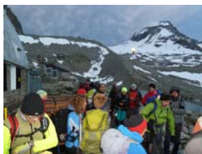
Valle d'Aosta-Gran Paradiso-Tresenta