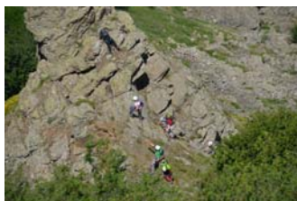
Ferrate sul nostro Appennino