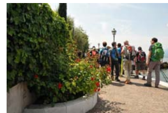
Veneto - Bassa Via Del Garda Veronese