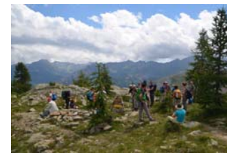
Valle d'Aosta - Monte Avic