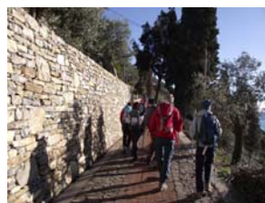
Sentiero V.A. - da Genova a Nervi